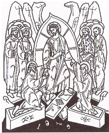
La Santa Resurrección